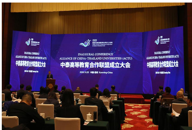
10 月 20 日，会议现场。

20 日，由云南省教育厅主办、昆明理工大学和东西方国际教育研究院承办的“中泰高等教育合作论坛暨中泰高等教育联盟成立大会”在云南海埂会堂开幕。中泰两国近 170 所大学的代表通过线上线下结合的方式参加了这次会议。