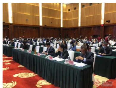
中泰高等教育合作论坛暨中泰高等教育联盟成立大会在昆举办

云南网讯（记者 陈怡希）10月20日，由云南省教育厅主办、昆明理工大学和东西方国际教育研究院承办的中泰高等教育合作论坛暨中泰高等教育联盟成立大会在昆举办。中泰两国近170所高校的代表通过线上线下相结合的方式参加会议。