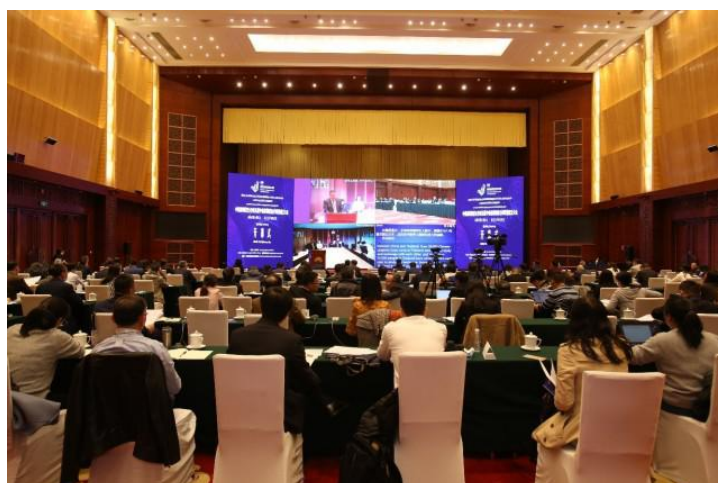
图 1：中泰高等教育合作论坛暨中泰高等教育合作联盟成立大会现场

10月20日下午，由云南省教育厅主办、昆明理工大学和东西方国际教育研究院承办的“中泰高等教育合作论坛暨中泰高等教育联盟成立大会”，作为2020南亚东南亚教育合作云上论坛的主要活动之一，在云南海埂会堂正式开幕。作为会议的重要成果，会上正式成立了“中泰高等教育合作联盟”并选举产生第一届联盟领导层。中泰两国近170所大学的代表通过线上线下结合的方式出席了这次国际教育盛会。