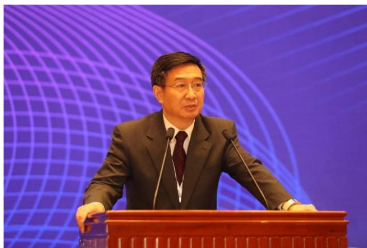
图 2：教育部中外人文交流中心主任杜柯伟发言

教育部中外人文交流中心主任杜柯伟，云南省委教育工委委员、省教育厅党组成员徐立，以及两个承办单位的领导云南昆明理工大学副校长马文会和东西方国际教育研究院院长王伟先生在开幕式上致词。