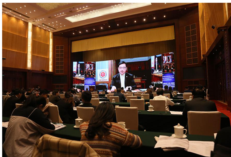
10 月 20 日，会议现场。

本次论坛以“创新课程合作模式，促进大学协同发展”为主题，议题涵盖“一带一路”视阈下中泰教育合作实践与构想、高等教育与可持续发展、预科教育在中泰高教合作中的作用、后疫情时代国际教育发展趋势等重要领域，并将就中泰高等教育课程合作的模式创新及最佳实践展开讨论。