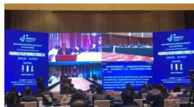
中泰高等教育合作论坛暨中泰高等教育联盟成立大会在昆举办