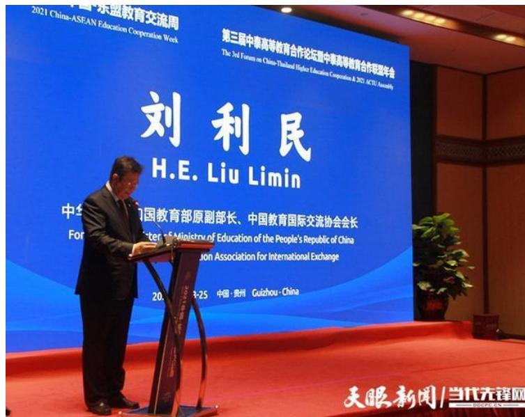
中国教育国际交流协会会长刘利民

“语言是沟通的工具，是人文交流的基础。民心相通的基础是语言互通。”刘利民建议，中泰双方未来应继续推进和深化双方在双边和多边框架下的语言教育合作，通过政策引导，强化长远合作机制，利用现代网络科技，搭建优质教学平台，加快培养具有对方语言交流能力的高素质复合型人才。