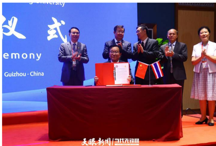
贵州大学与清莱皇太后大学签署合作协议