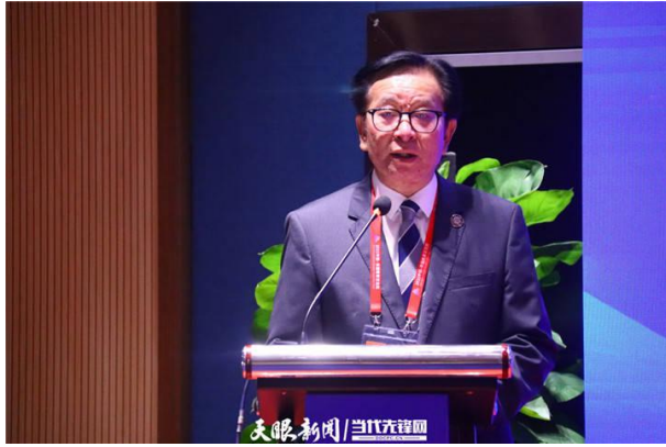
贵州大学党委书记李建军

近年来，中国-东盟关系稳步发展，中泰两国教育科研领域成效颇丰。2020年10月20日，由中泰14所大学和教育机构共同发起的“中泰高等教育合作联盟”在云南昆明成立，丰富了中泰教育交流合作的实质。