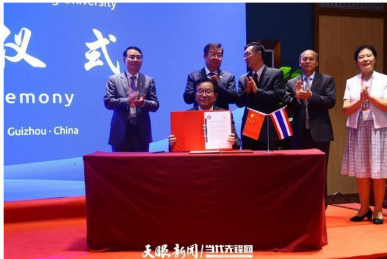
贵州大学与清莱皇太后大学签署合作意向书

值得一提的是，活动期间，江苏大学与清迈大学就共建联合实验室、北京语言大学与暹罗大学就双方战略合作并共建国际中文专业、贵州大学与清莱皇太后大学、贵州理工学院与北清迈大学就双方合作，分别签署了协议和意向书。