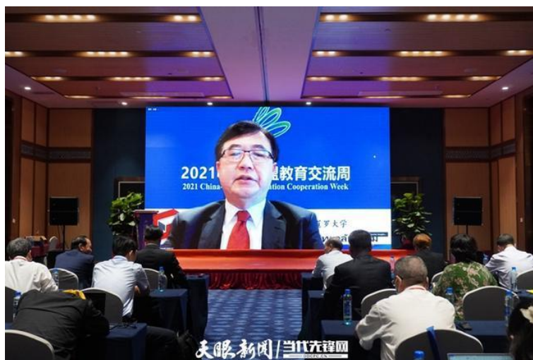
中泰高等教育合作联盟泰方常务理事单位代表发出线上倡议

值得一提的是，活动期间，江苏大学与清迈大学就共建联合实验室、北京语言大学与暹罗大学就双方战略合作并共建国际中文专业、贵州大学与清莱皇太后大学、贵州理工学院与北清迈大学就双方合作，分别签署了协议和意向书。