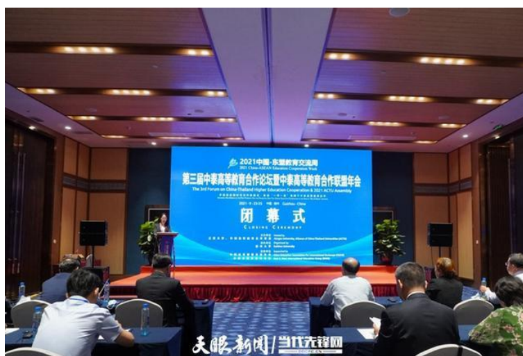
第三届中泰高等教育合作论坛暨中泰高等教育合作联盟年会闭幕式

【链接】 https://baijiahao.baidu.com/s?id=1711877301269958769&wfr=spider&for=pc